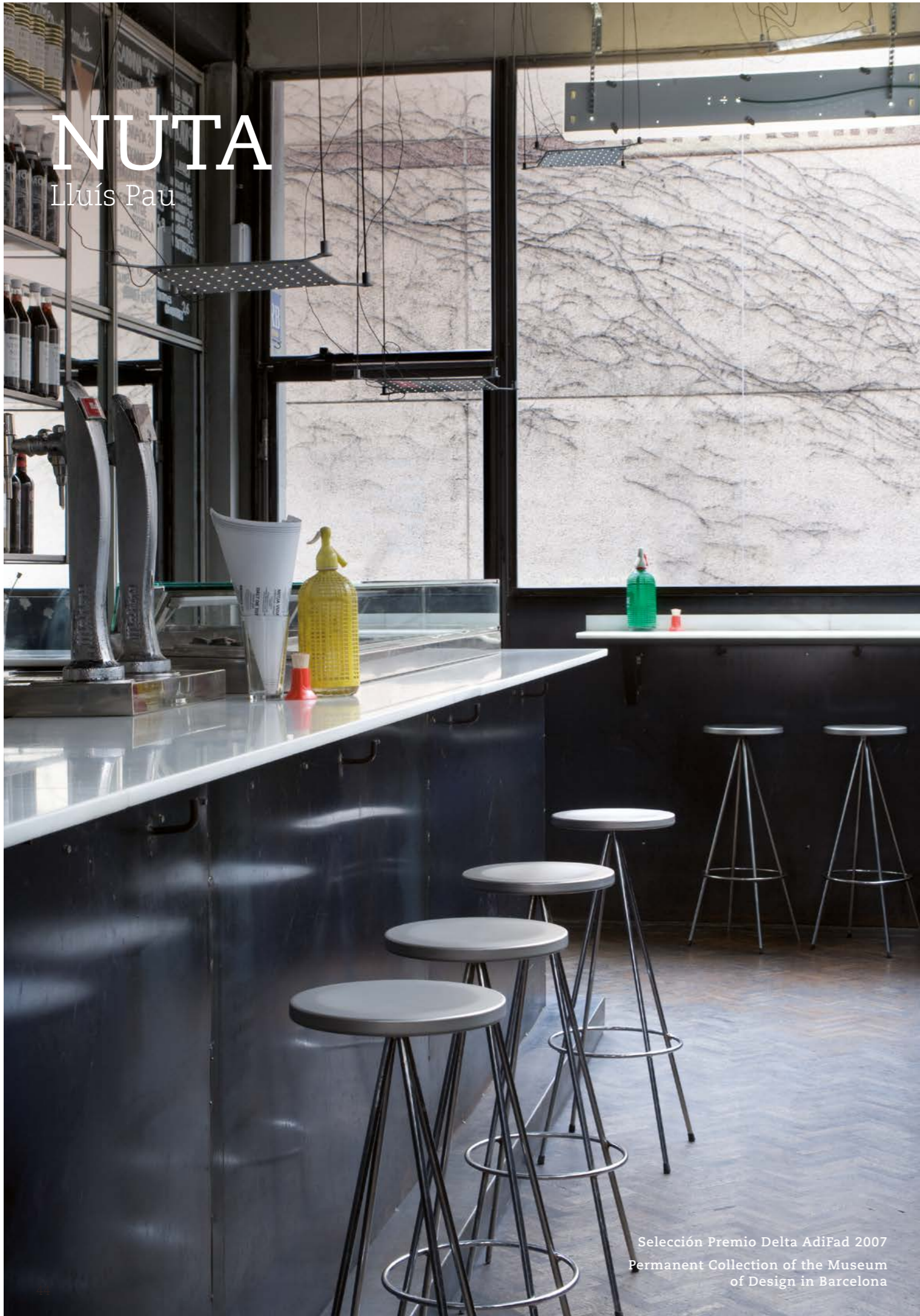
Selección Premio Delta AdiFad 2007 Permanent Collection of the Museum of Design in Barcelona