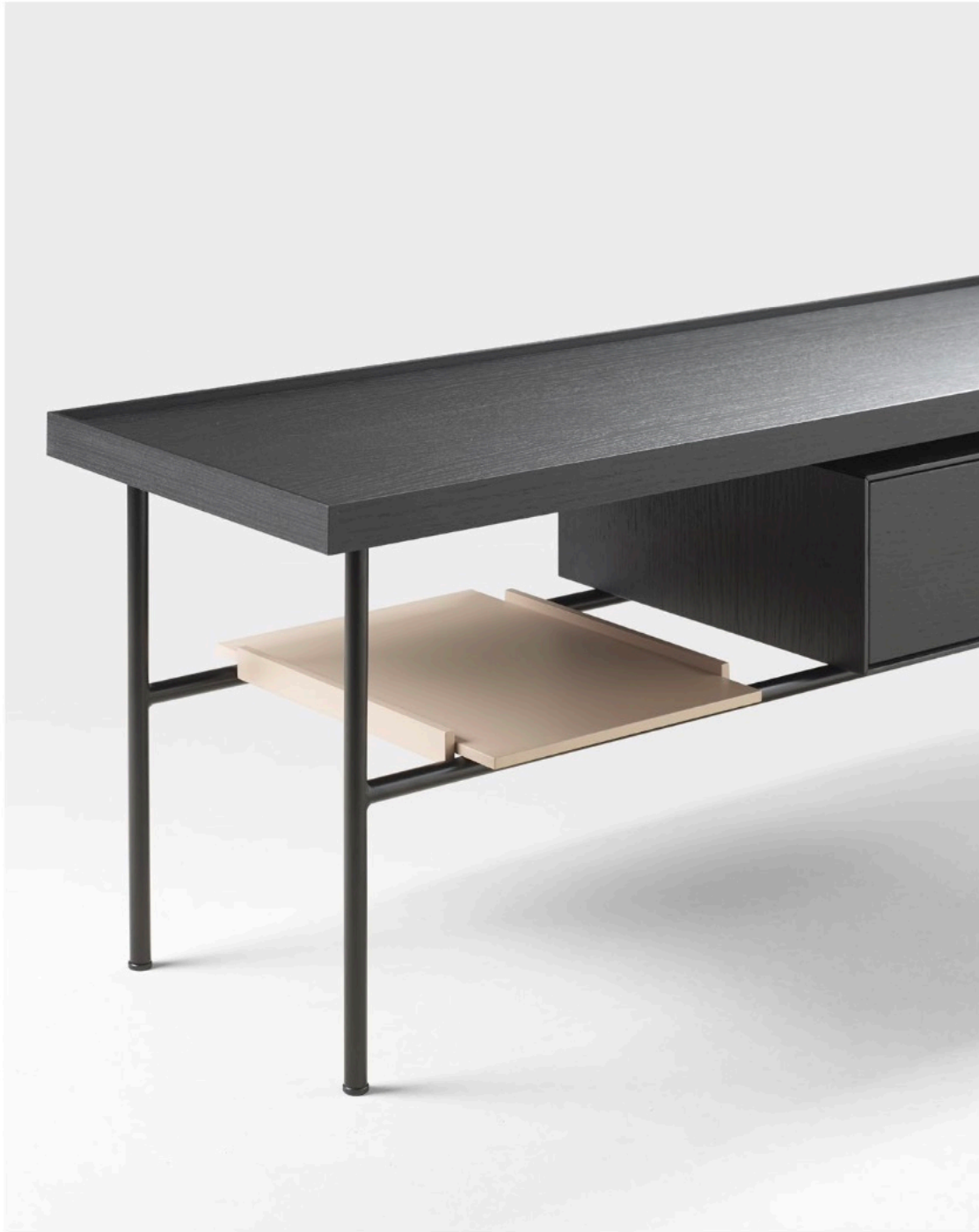
Detail of the tray (lacquered in Nude color) in the media unit of the Kutxa collection. Detalle de la bandeja (lacada en color Nude) en el mueble bajo de la colección Kutxa.