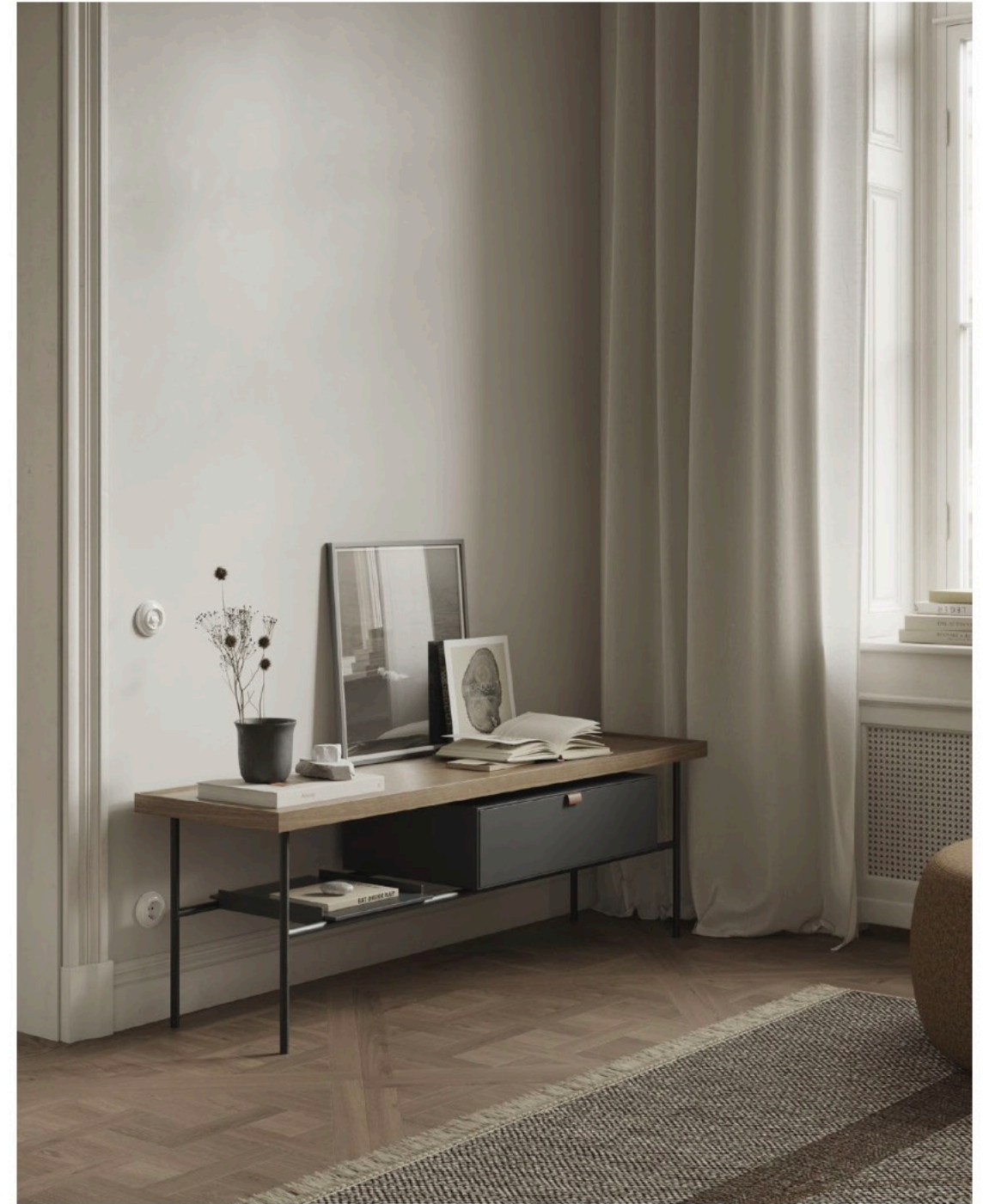
Kutxa collection media unit with top in walnut and graphite lacquered drawer. Mueble bajo de la colección Kutxa con encimera en nogal y cajón en lacado grafito.