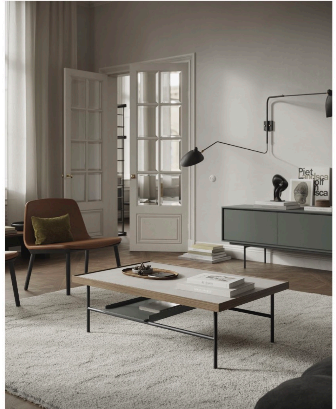
Rectangular Kutxa coffee table. Mesa de centro Kutxa en formato rectangular.