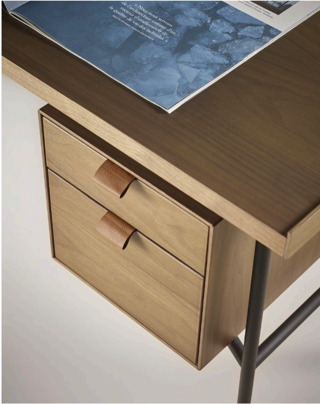
Detail of chest of drawers with leather handles for kutxa desk. Detalle de la cajonera del escritorio Kutxa y sus tiradores en piel.