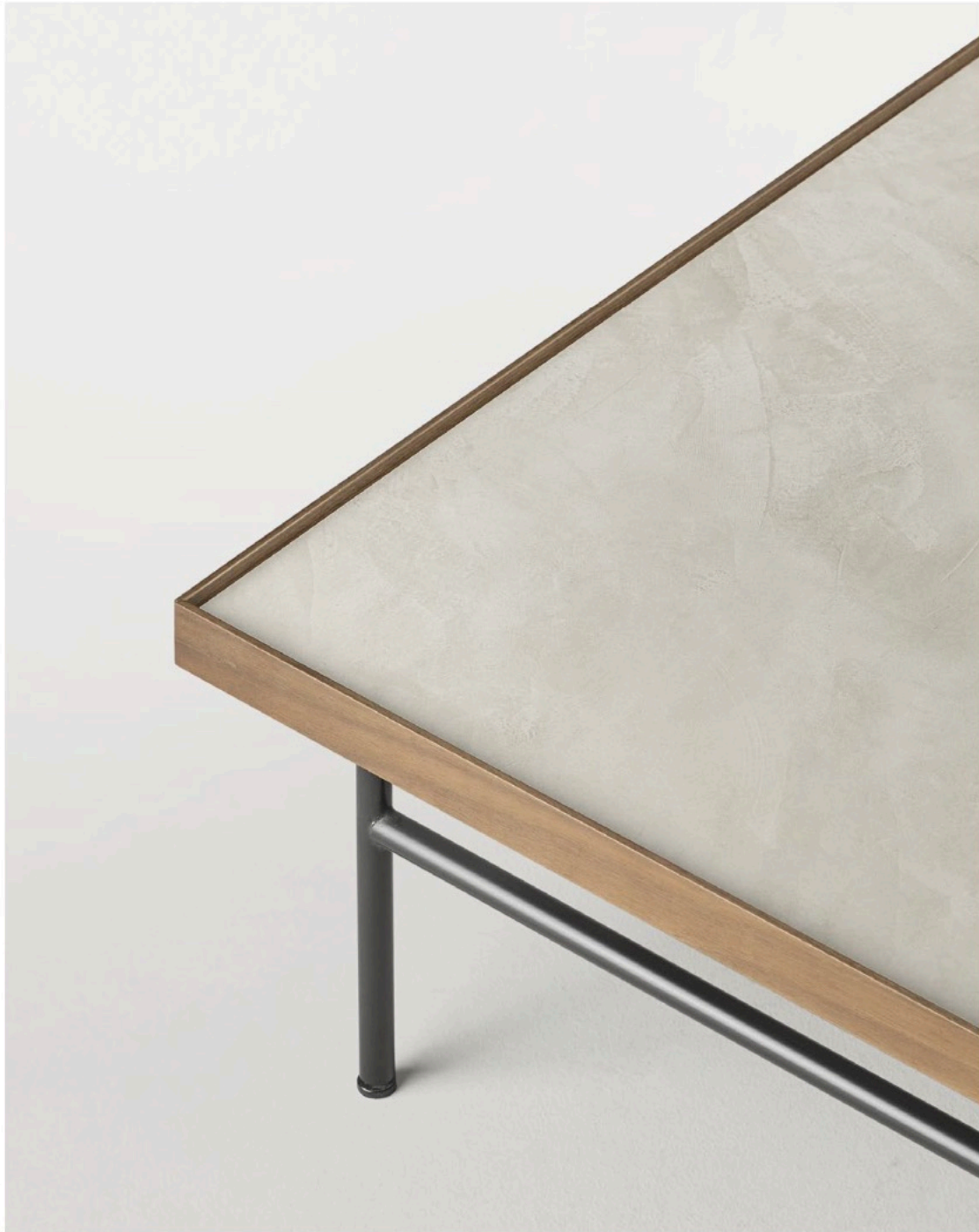
Porcelain finishing detail of Kutxa coffee table. Detalle del acabado porcelánico de la mesa de centro Kutxa.