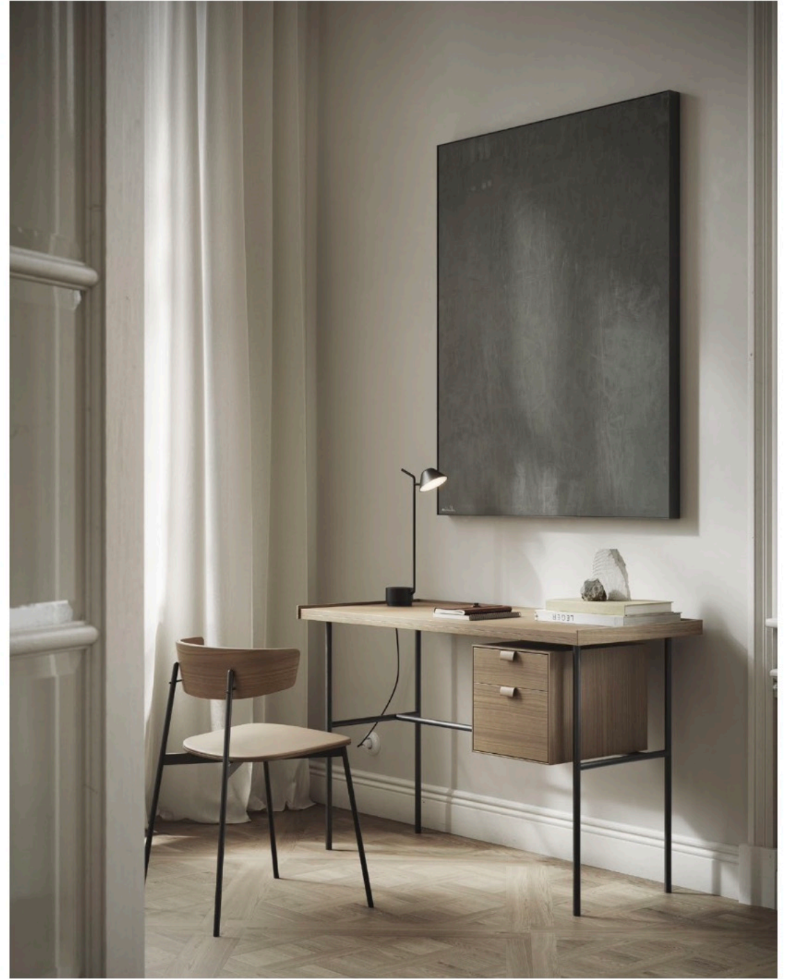
Kutxa desk and kol chair, both in walnut. Escritorio Kutxa y silla Kol, ambos en nogal.