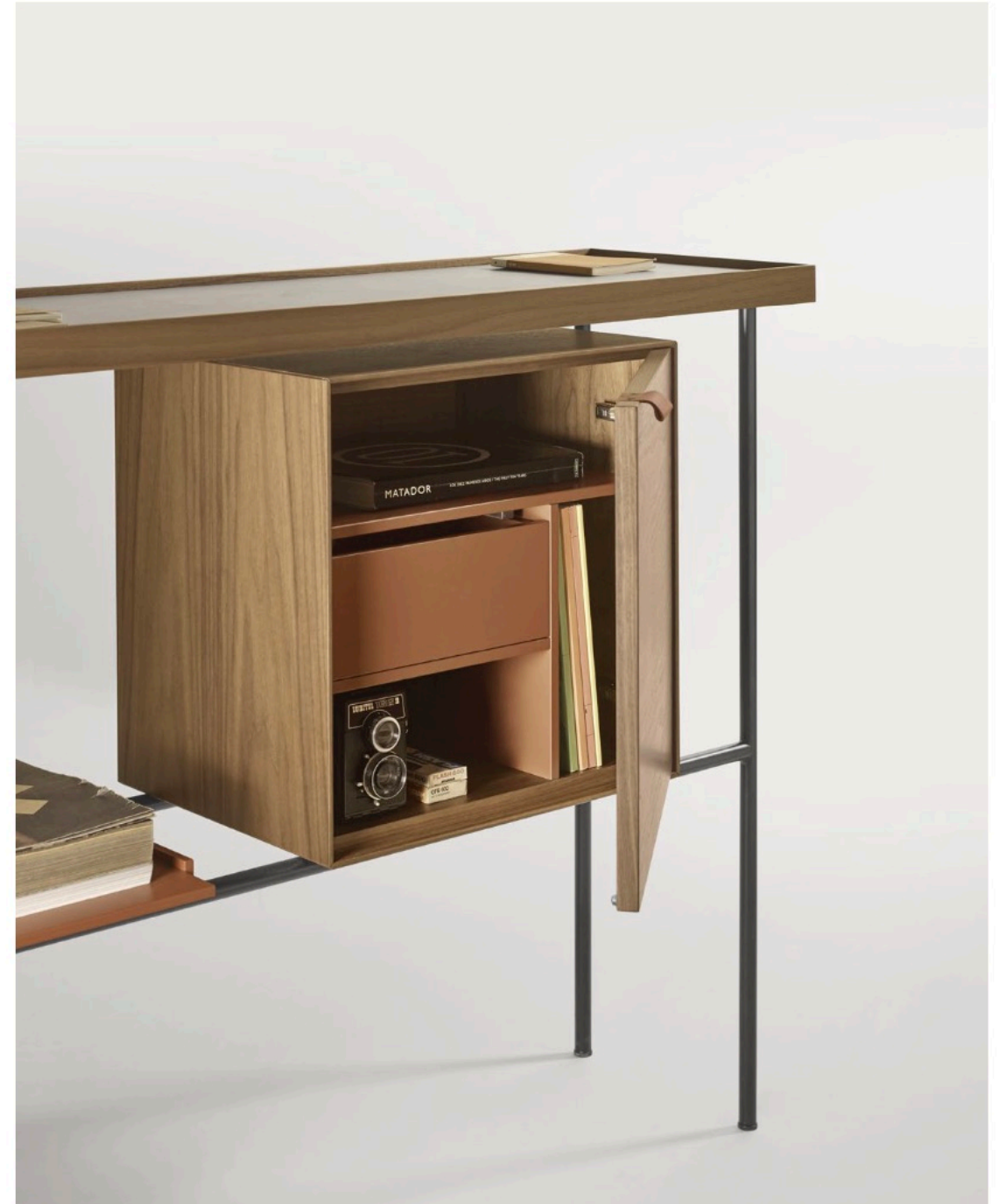
Inside detail of Kutxa high sideboard. Detalle del interior de la consola Kutxa.