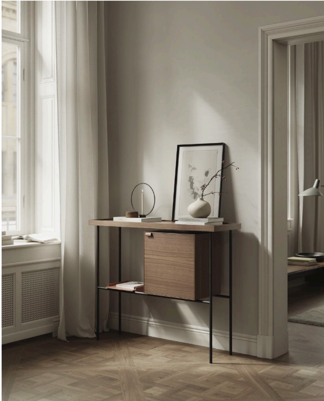
Kutxa high sideboard. Consola Kutxa.