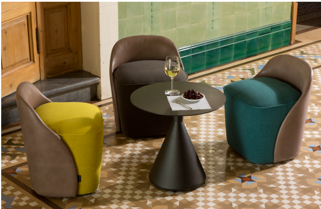
Cone Table 50 Hierro negro | Black iron