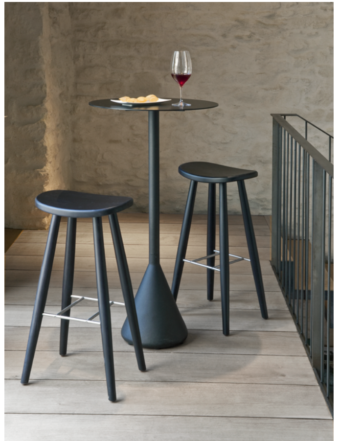
Cone Table 75 Hierro negro | Black iron