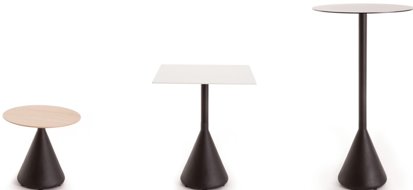
Table with a cast aluminium base and lacquer finish available in three different heights: 50, 75 and 105 cm. You can choose to have the table top in cast iron, compact HPL or plywood. This is the classic bar table with a twist: all the visual weight is in its solid base, creating a unique outline.

Mesa con base de fundición de aluminio acabado lacado disponible en tres alturas distintas: 50, 75 y 105 cm. Puedes elegir el sobre en chapa de hierro, HPL compact y contrachapado. Es una clásica mesa de bar con un twist: todo el peso visual está en su sólida base, creando un perfil único.